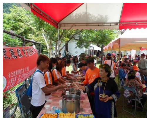
地方頭目享用原生美食